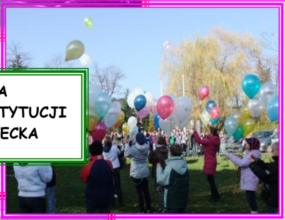
20 ROCZNICA UCHWALENIA KONSTYTUCJI O PRAWACH DZIECKA