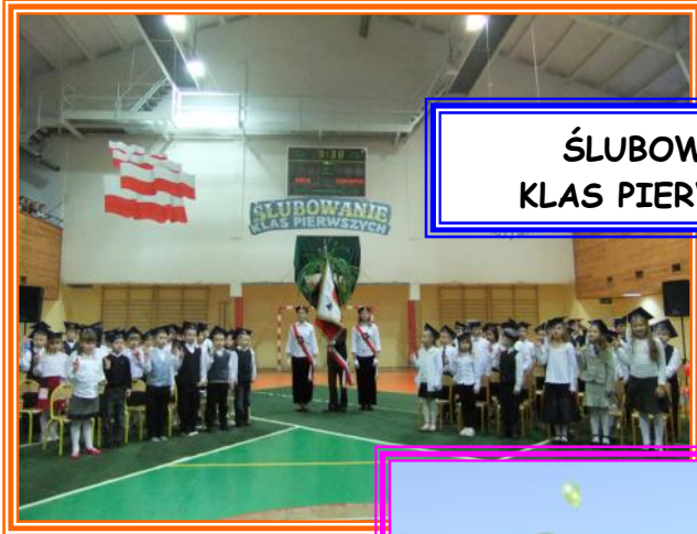
ŚLUBOWANIE KLAS PIERWSZYCH