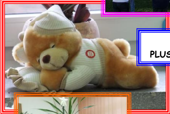
DZIEŃ PLUSZOWEGO MISIA